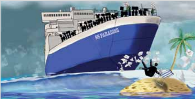
Grafik: ICIJ / Rocco Fazzari

Der geplante Hafen liegt in der angolanischen Exklave Cabinda, nördlich von Angola. Zwischen Angola und Cabinda erstreckt sich ein schmaler kongolesischer Landstreifen mit dem Kongo-Fluss und seiner Mündung. Im Mündungsbereich existieren bereits nicht weniger als drei Häfen: Matadi (Kongo), Banana (DR Kongo) und Soyo (Angola). Da der Kongofluss zwischen dem Hafen Matadi und den Hauptstädten der beiden Kongos nicht schiffbar ist, erfolgt der Transport ins Landesinnere über Schienen und Straßen. Diese Häfen liegen allesamt näher an Angola als der im Bau befindliche Porto do Caio in Cabinda. Falls dieser überwiegend für Angola bestimmt sein sollte: Gibt es