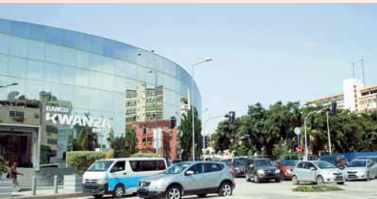
Banco Kwanza in Luanda.

Vicente war 2012-2017 der letzte Vizepräsident der Ära von Eduard dos Santos. Zuvor saß er dreizehn Jahre lang (1999-2012) als CEO der staatlichen Erdölfirma Sonangol vor und hatte damit den Schlüssel zur einträglichsten Einnahmequelle des Landes in der Hand: Angola erwirtschaftet (bzw. erwirtschaftete bis vor Kurzem) 90 Prozent seiner Exporte mit Öl, und Sonangol regelt die Geschäfte. 9