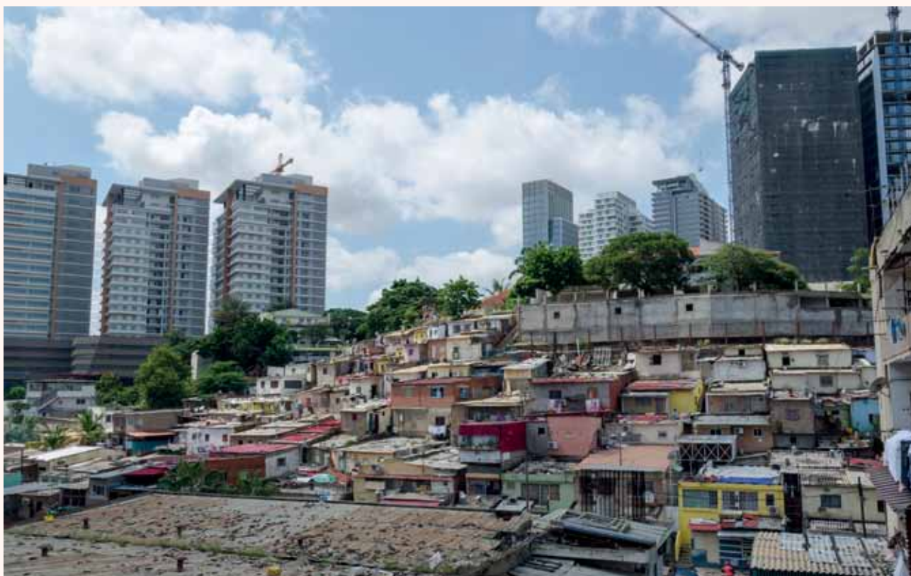
Bedarf an sozialen Projekten: Informelle Siedlung in Luanda.

Seine Investitionen in Angola dienen kaum dem Land. Für ähnliche Geschäfte wurde Jean-Claude Bastos in der Schweiz verurteilt.