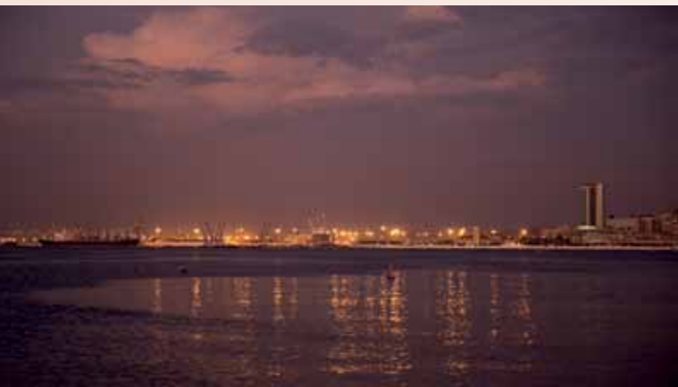
Luanda leuchtet.

Ein Gericht im Kanton Zug befand Krüse und Bastos de Morais im Dezember 2011 «der mehrfachen qualifizierten ungetreuen Geschäftsbesorgung» für schuldig und verurteilte die beiden rechtskräftig. Dank tatkräftiger Unterstützung von Personen aus Politik, Wissenschaft,