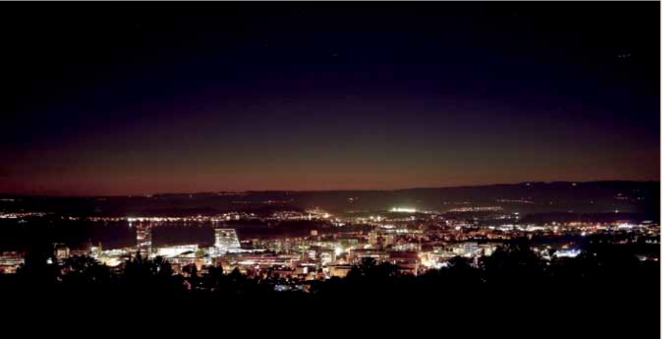
Zug gilt selbst innerhalb der Schweiz als Steueroase.

Wie auch immer Bastos zu seinem Vermögen gekommen ist, jedenfalls betätigte er sich vor elf Jahren fleißig als Firmengründer in enger Zusammenarbeit mit dem Sohn des Präsidenten und dem Ziehsohn des Vizepräsidenten – dem Mann, der als erster angolischer Milliardär unter 40 Jahren in die Annalen einging («Zenu») 20 , und dem Ziehsohn des Mannes, der zu diesem Zeitpunkt die ergiebigste Geldquelle befehligte.