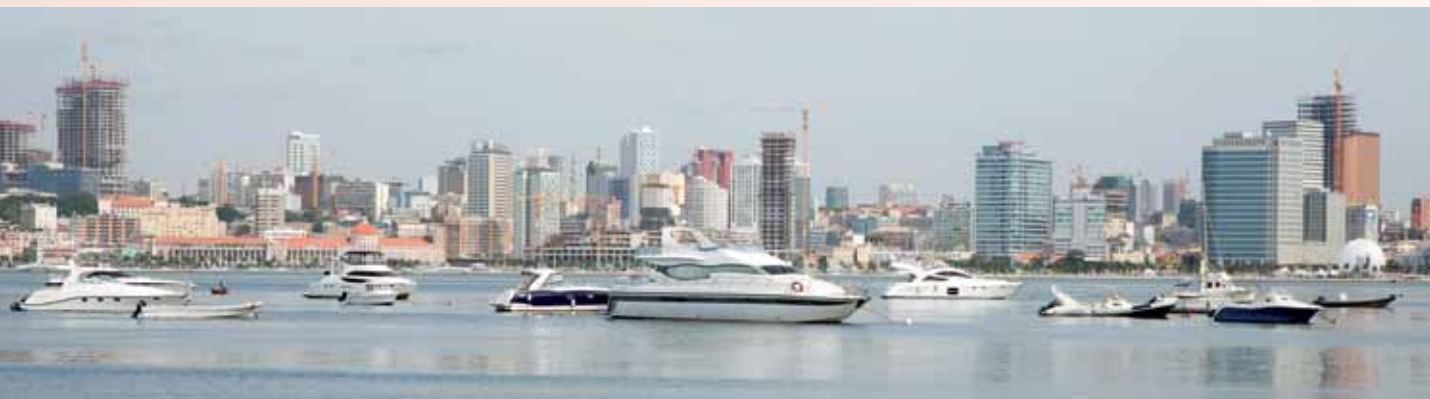
Yachten vor Luanda.

Fonds für Risikokapital ( Fundo Activo de Capital de Risco Angolano , FACRA) eröffnet und die Verantwortung dafür ebenfalls bereits seinem Sohn «Zenu» übertragen. Die Bank, über die dieser Fonds operativ wurde, ist einmal mehr der Banco Kwanza Invest (KWI) 26 – angeblich, weil dies die einzige angolansische Investitionsbank sei, die mit diesem Auftrag nicht in einen Interessenkonflikt gerate. 27