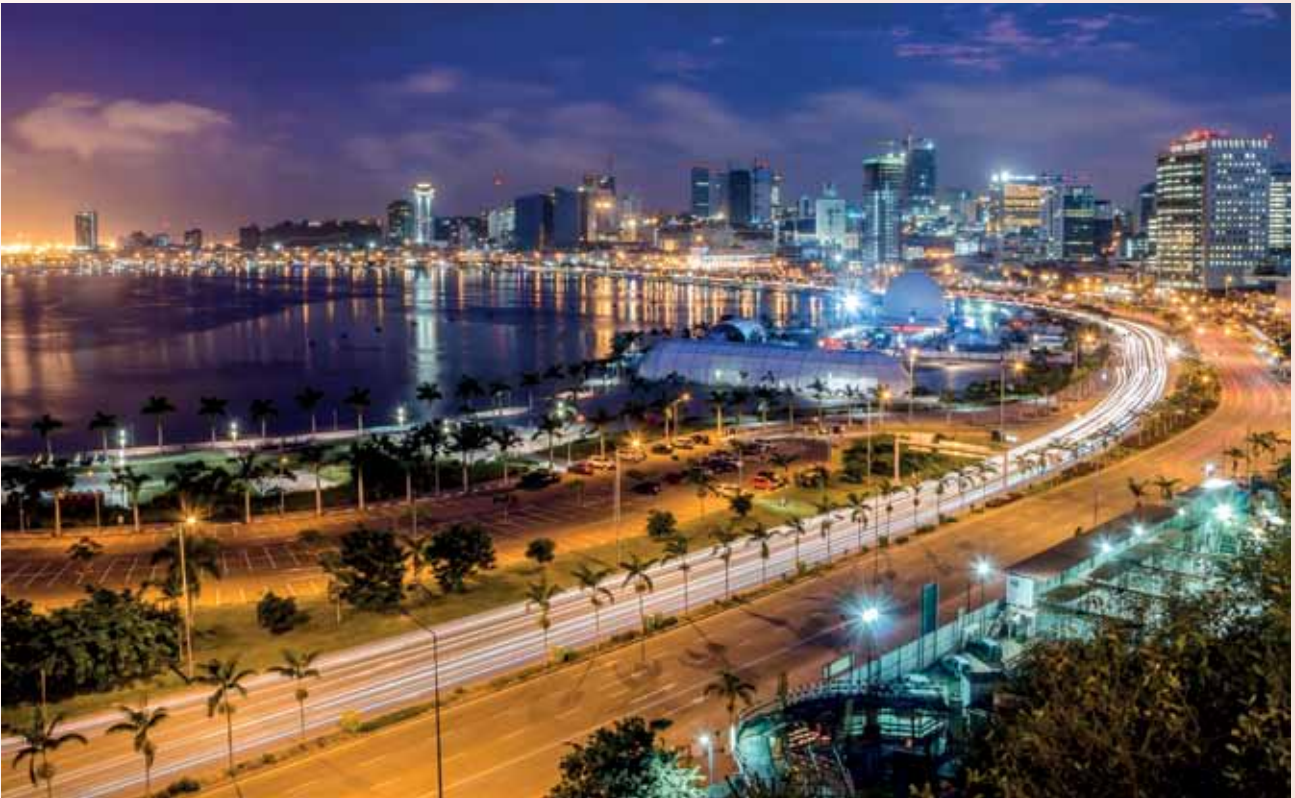
Hafenpromenade in Luanda.

– Quantum Global (Bahnhofstrasse 2, 6300 Zug) –, die ihn bei seinen vielfältigen Arbeiten in seinen diversen Unternehmen unterstützt.